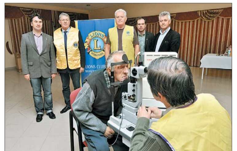
A Lions kisbusza sorra járja a kistelepüléseket